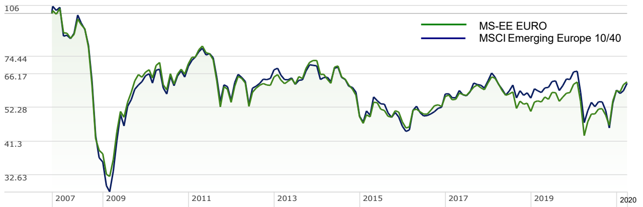
กราฟแสดงการเปรียบเทียบจากเงินลงทุน 100 บาท ตั้งแต่วันที่จัดตั้งกองทุน